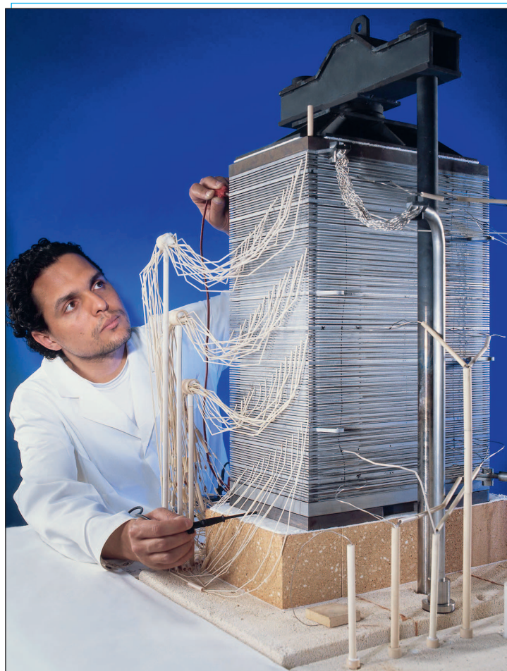
Aus 60 Zellebenen ist die Hochtemperatur-Brennstoffzelle im Forschungszentrum Jülich aufgebaut

Wissenschaftler des Forschungszentrums Jülich haben erstmals mit einer Hochtemperatur-Brennstoffzelle mit Festelektrolyt (SOFC) eine Leistung von 13,3 Kilowatt erreicht. Die Forscher des Jülicher Instituts für Werkstoffe und Verfahren der Energietechnik (IWV) und der Zentralabteilung Technologie (ZAT) verschalteten dazu 60 ebene Einzelzellen zu einem 40 Zentimeter hohem Brennstoffzellen-